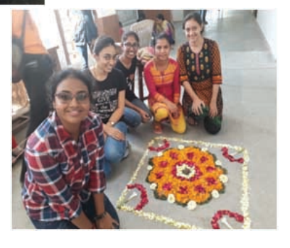
Rangoli with flowers