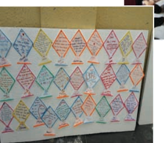
GUBS wall full of creative messages