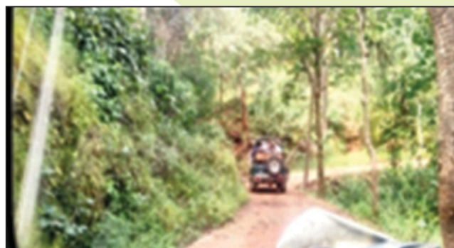
Forest area visit

The staff and M Sc Botany Sem III students of the department went to Pachmarhi ( M.P.) and