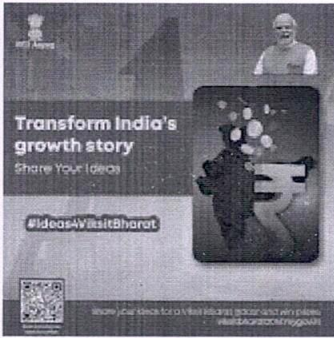
viksat bhara 3.jpg 184K