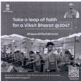
viksat bharat 2.jpg 201K