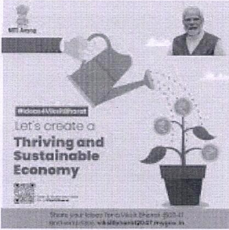
viksat bhara 4.0.jpg 191K